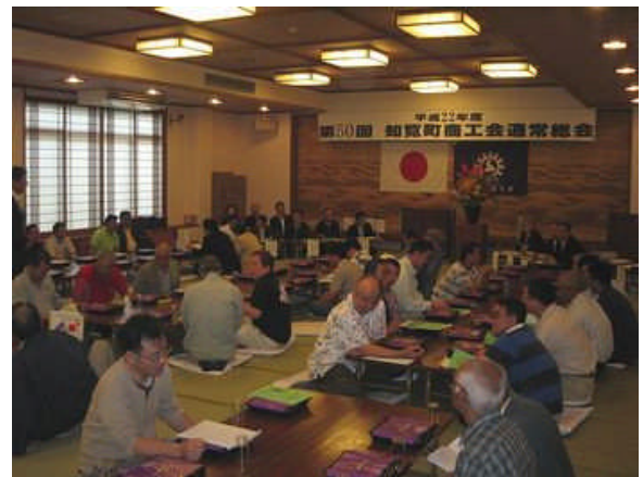
今年も多くの会員皆様のご出席を頂き、誠にありがとうございました。