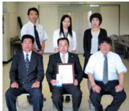
平成19年5月24日(木) 商工会事務所にて受賞

県信用保証協会は、信用保証業務の推進に優れた実績をあげた商工団体に表彰を贈る制度があり、当商工会は2年連続の表彰を受けました。これは、各年度末における県制度資金の保証債務残高の増加率および同年度平残代弁率等を勘案し選定される。